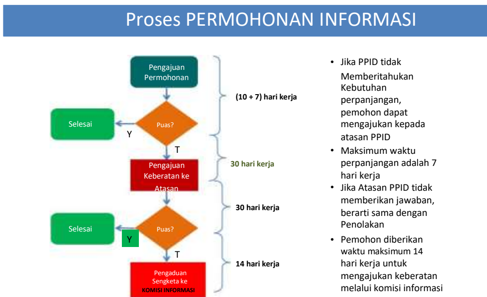
Gambar :2.1 Proses Permohonan Informasi

4. Jika permohonan informasi diterima, maka dalam surat pemberitahuan juga dicantumkan materi informasi yang diberikan, format informasi, apakah dalam bentuk soft copy atau data tertulis, serta biaya apabila dibutuhkan untuk keperluan penggandaan atau perekaman. Bila permintaan informasi ditolak, maka dalam surat pemberitahuan dicantumkan alasan penolakan berdasarkan UU KIP.